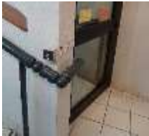
Rez-de-chaussée avec bouton d'appel (aide)

Ascenseur sur l'ensemble des sites , où les formations sont dispensées à l'étage ou sites disposant de marches pour accéder aux salles (Cholet, Challans, La Rochelle, La Roche-sur-Yon). (Exemple Cholet ci-dessous)